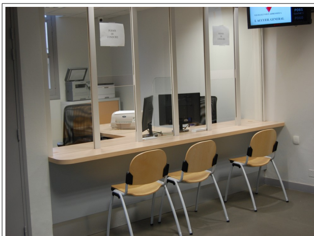
Service des permis de conduire de la sous-préfecture de Compiègne

Des enquêtes menées auprès des usagers des deux sites démontrent une satisfaction générale pour ces nouvelles configurations.