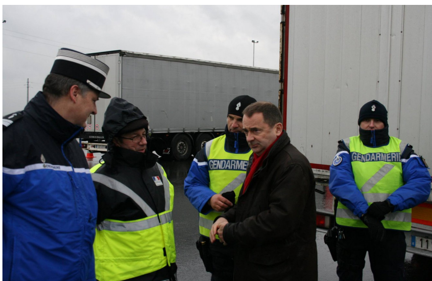
Le préfet de l'Oise lors d'une opération de contrôle routier

Les forces de l'ordre ont consacré 114 093 heures à la sécurité routière soit en moyenne 50 gendarmes mobilisés par jour pour :