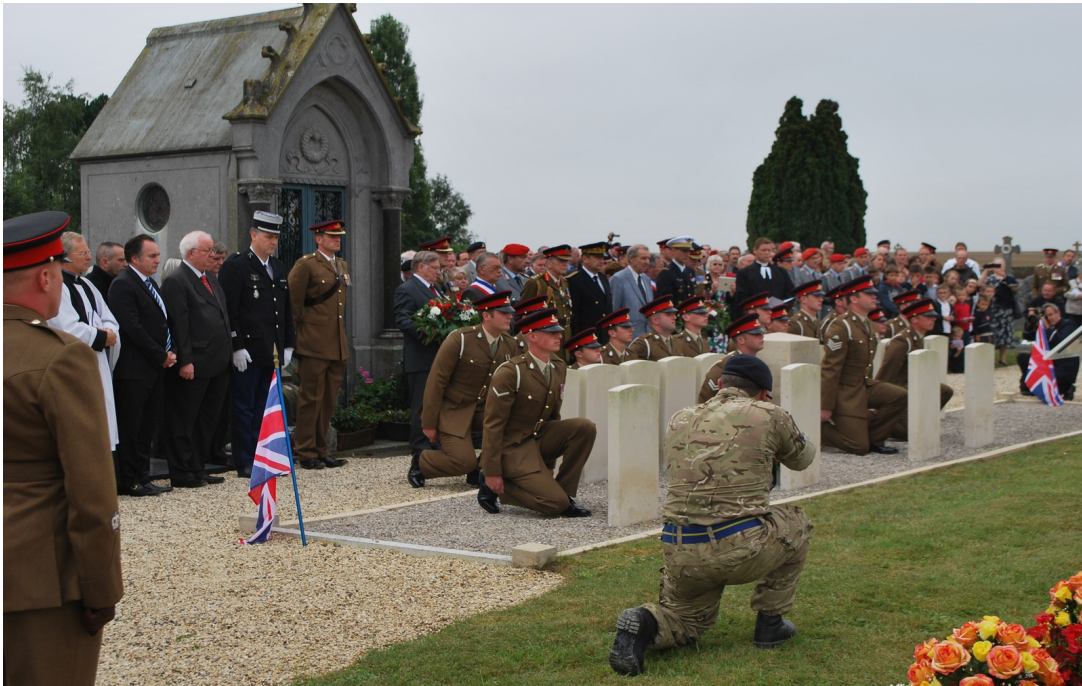
Cérémonie commémorative de Néry le 1er septembre 2014 en présence du préfet de l'Oise, et avec la participation des troupes anglaises, allemandes et françaises

L'année 2014 marquant également le 70ème anniversaire de la résistance, de la libération de la France et la victoire sur le nazisme, l'ONACVG a eu à anticiper cet événement en labellisant via la commission mémoire départementale, les initiatives des collectivités locales dont le contenu et le rayonnement leur conféraient une dimension particulière et en accompagnant financièrement les porteurs de projets : à titre d'exemple, une exposition de mars à juin 2014 des "carnets de guerre 1939-1944" de Robert de la Rivière, dit Rob Roy.