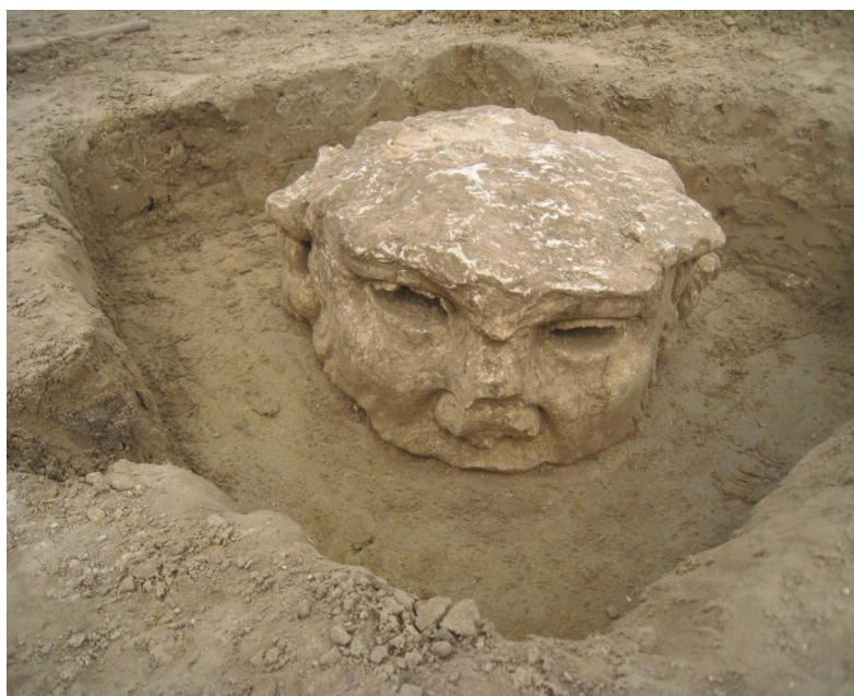
Photos des découvertes archéologiques de Pont-Sainte-Maxence